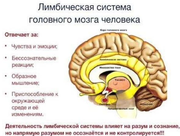
Рисунок 3. Лимбический мозг

Самый первый рептильный мозг краткое описание эмоциональные нейropsychологические особенности девиантного поведения среди молодежи. Изменения в поведении, хладнокровное поведение, отсутствие эмпатии, повышенная чувствительность органов чувств, обман, ложь, агрессия, защита своей территории, опасность, гнев реакция, грубость, беспечность, неуважение к старшему младшему, страх, желание владеть всем и управлять всем, борьба за власть, игнорирование кого-либо, они внутренне не могут судить о своем поведении и поступках, реагируют на такую реакцию. Психолого-социально-педагогический контроль, развивающийся на основе безразличия, невнимательности окружающих людей к подросткам, В результате возникает чувство одиночества, запущенности, ненужности, незащитности. Возникает сопротивление старшим, чувство неприязни, ненависти.